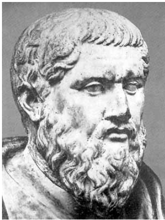
Abb. 1: Platon

vollständig aus der Politik zurückzuziehen und ein Kritiker der Demokratie zu werden. Er hörte jedoch nicht auf, weiter über den Staat zu philosophieren.