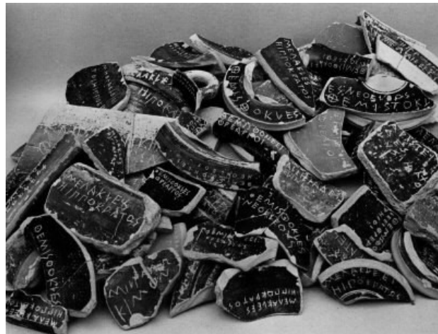
Abb. 4: Tonscherben des ostrakismos

Ein weiteres gerichtliches Organ war die Volksversammlung, welche mit dem Scherbengericht (ostrakismos) die Verbannung gegen einzelne Bürger Athens aussprechen konnte. Jährlich gab es die Möglichkeit, ein Scherbengericht abzuhalten. Dabei ritzte jeder Teilnehmer den Namen eines Atheners, den er in die Verbannung schicken wollte, auf eine Tonscherbe. Kamen 6000 Scherben gegen einen Bürger zusammen, wurde dieser für zehn Jahre aus Athen verbannt.